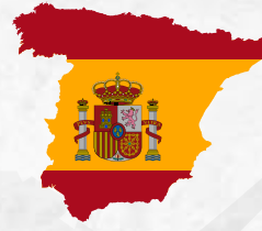
3 - İspanya (Spain)