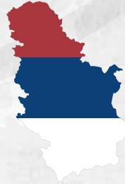
6 - Sırbistan (Serbia)