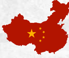
5 - Çin (China)