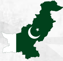
4 - Pakistan (Pakistan)