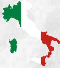
1 - İtalya (Italy)